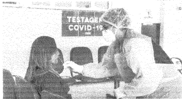
Passageiros que utilizam o Terminal da Ponta da Espera estão sendo submetidos a testagem